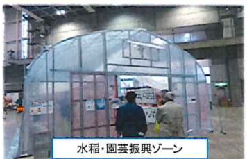
水稻・園芸振興ゾーン