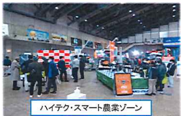
ハイテク・スマート農業ゾーン