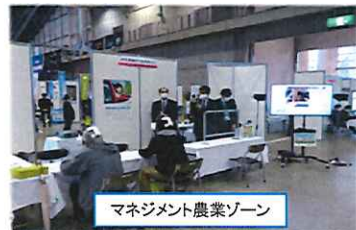
マネージメント農業ゾーン