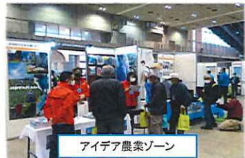
アイデア農業ゾーン