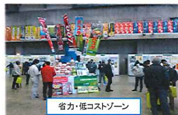
省力・低コストゾーン