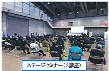
ステージセミナー(3講座)