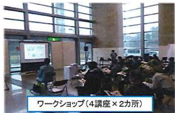
ワークショップ(4講座×2カ所)