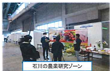
石川の農業研究ゾーン